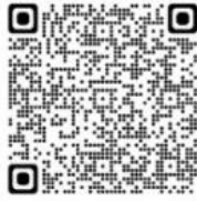
陽性の方へのご案内／県HP

※ 症状があるにもかかわらず陰性（-）結果が出る際には医療機関受診をお勧めします。